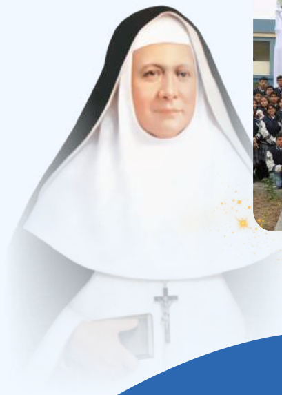
Consagración a la Virgen María